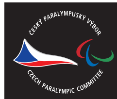
plnobarevné provedení rozšířená verze