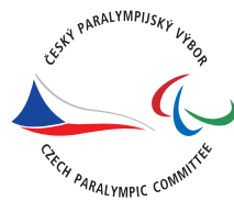
plnobarevné provedení základní verze